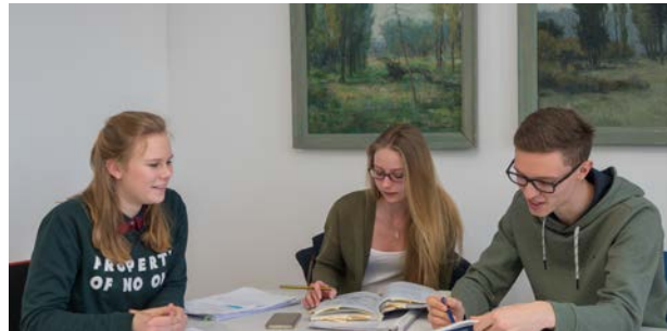
Unsere Auszubildenden bei der Prüfungsvorbereitung